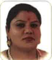
NAUKAT BINDIYA HYD CITY WOMEN VICE PRESIDENT